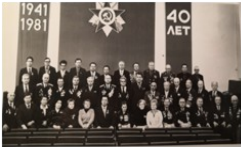
В гостях у михайловцев освободители нашего города от немецко-фашистских захватчиков. 1981 г.